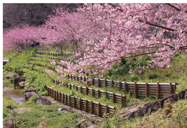
畑毛せせらぎ公園

計画で示す町の取り組みは、近年の時代潮流を踏まえ、これまでに町で実施してきた様々な取り組みを検証し、今後5年間で実施する施策および事業等を体系的に示します。