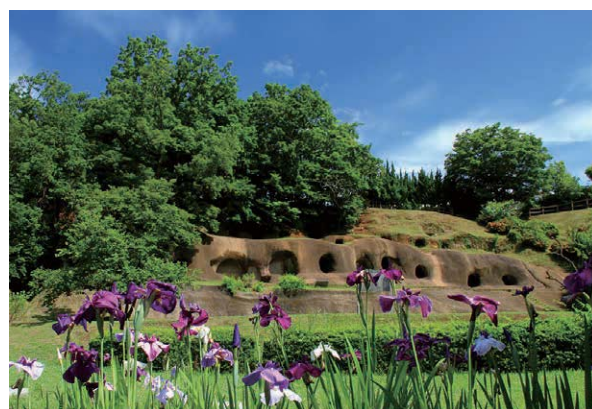
史跡（国指定柏谷横穴群）