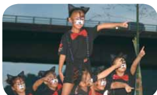
▲「猫じゃ猫じゃコンテスト」では熱いダンスが繰り広げられました

子どもから大人まで、思い思いの猫に扮したたくさんの方の姿が見られました。来場者は、盆踊りのように輪になって踊る「猫おどり」のほか、ダンスを競う「猫じゃ猫じゃコンテスト」やコスプレを競う「ネコスプレ」を楽しみました。