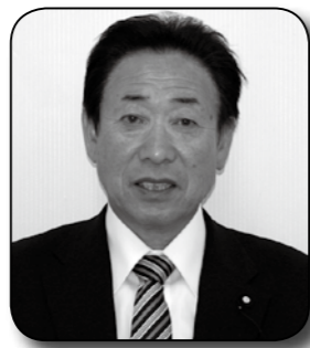
議長 米山 祐和