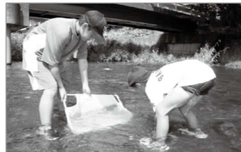
申込・問合せ先／環境衛生課 (979-8112)

日時／7月29日(金) 午前の部 8時30分～12時 午後の部 13時～16時30分 場所／函南町役場 3階中会議室集合、来光川(上沢観音橋付近)、柿沢川(畑毛せせらぎ公園) 対象／小学4年生～6年生 (保護者同伴可) 募集人数／40人(先着順) ※応募が20人以下の場合は午後の部のみ開催します。 参加料／無料 内容／川底の石などについている生物を捕まえ、分類して水質状況を調べます。 持ち物／帽子、ぬれてもいい運動靴、タオル、筆記用具 その他／当日が雨天の場合