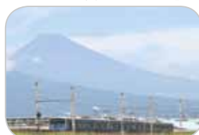
▲蛇が橋付近の撮影スポット 『いずっぱこ』と富士山

あなたも電 車に乗って、 いつもと違っ た地域の魅力 を探してみて はいかがです か。