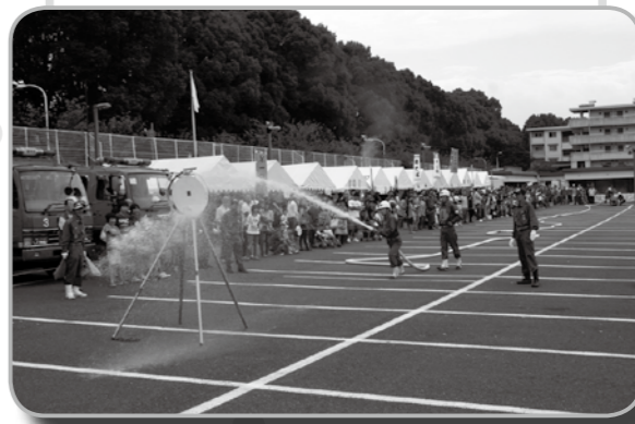
▲小型ポンプ操法を来場者に披露している様子