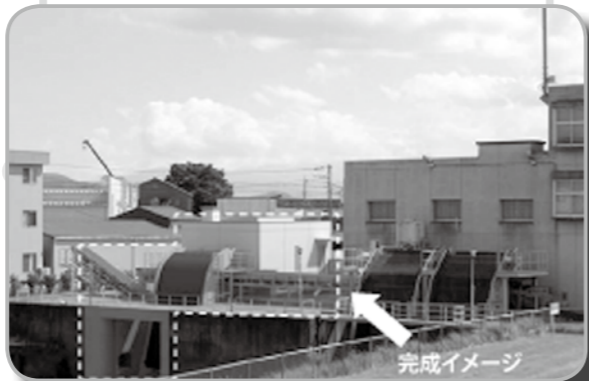
▲函南観音川排水機場の完成イメージ