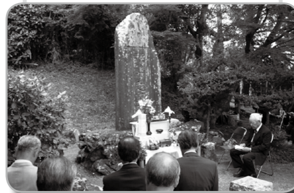
▲殉職者へ感謝と祈りを捧げる参列者

10月2日、函南駅近くの丹那トンネル工事殉職者慰霊碑前で、丹那トンネル工事殉職者慰霊式が行われました。 私たちの身近な存在である丹那トンネル。昭和9年開通までの16年間にわたる建設工事では、67人もの尊い命が失われています。 当日は関係者約40人が出席し、殉職者への労いと感謝の気持ちを込めて焼香、読経などが捧げられました。