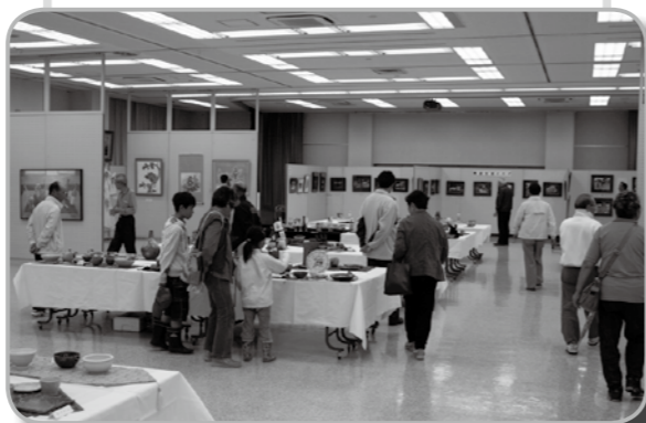
▲函南町文化祭 前期作品展の様子

10月22日～30日、函南町中央公民館などで、第43回函南町文化祭が行われました。