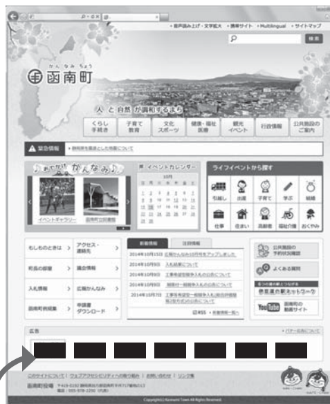
ホームページ有料広告部分

株式会社ホープ セールスプロモーション部 住所：福岡県福岡市中央区薬院ビル 7F 電話：092-716-1404、FAX：092-716-1467 メール：infozaigenkakuho.com URL：http://zaigenkakuho.com