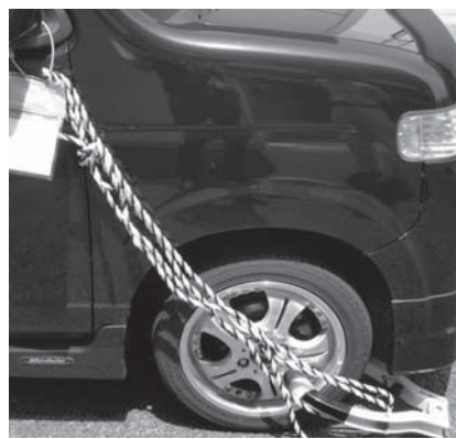
▲タイヤロックによる自動車の差し押さえ

STOP! 滞納 保険など)を差し押さえます。差し押さえは法律に基づく自力執行権により裁判所を介さず町の判断で実施する強制処分です。 ▼公売などの強制換価処分を受けます 公売などの強制換価処分は、大切な町税を確保するためにやむを得ず行う最終的な処分です。 平成21年度よりインターネット公売を実施しており、現在も継続して行っています。