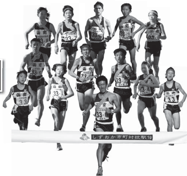
問合せ先／静岡県市町対抗駅伝函南町実行委員会事務局 (電話：979-1733 FAX：979-1744)

函南町選手団が、12区間 42.195kmを思いのこもったタスキをつなぎ、ゴールの草薙陸上競技場を目指して走ります。