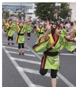
▲猫おどりパレード (左) と猫おどりマスコットキャラクターのシロにゃん (右)