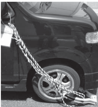
▲タイヤロックによる自動車の差し押さえ

公売などの強制換価処分は、大切な町税を確保するためにやむを得ず行う最終的な処分です。平成21年度よりインターネット公売を実施しており、現在も継続して行っています。