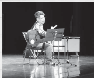
▲自作の歌を披露する講師

当日は、託児も行われ、子連れの参加者が安心して講演を聞ける環境を整えました。ご協力いただいたボランティアの皆さん、ありがとうございました。