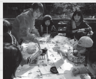
▲絵手紙を作りました

完成した絵手紙は、ポストに背を伸ばして投函し、大好きな人に送りました。このような秋を感じる素敵な1日を過ごしました。