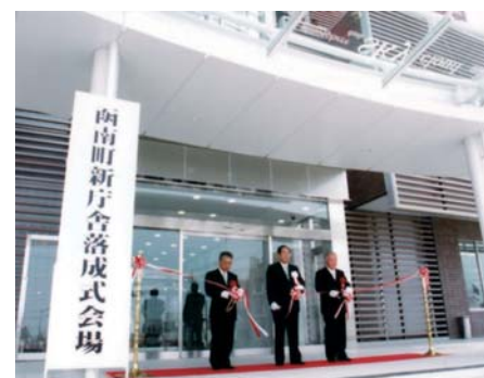
函南町役場庁舎竣工