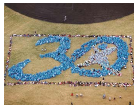
町制施行30周年記念事業「BIGKANCANまつり」