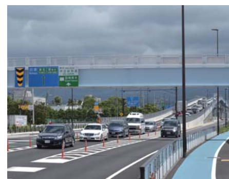
東駿河湾環状道路（三島塚原～函南塚本）開通