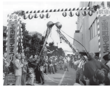
第1回函南町商工まつり