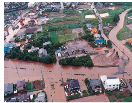
平成10年8月の集中豪雨