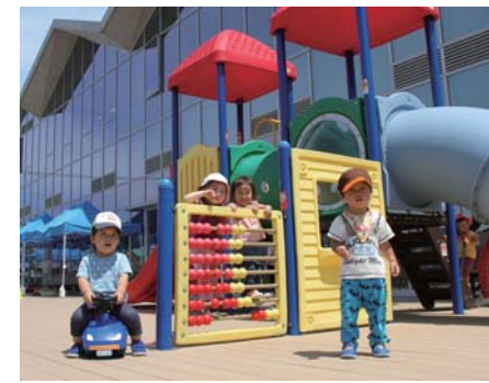
子育て交流センター ふれあいプラザ