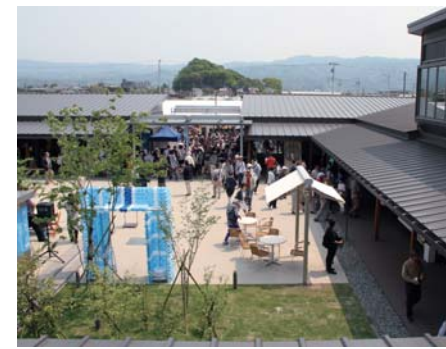
道の駅「伊豆ゲートウェイ函南」開駅