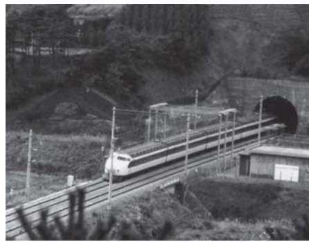
新丹那トンネル開通により新幹線が函南町を通過