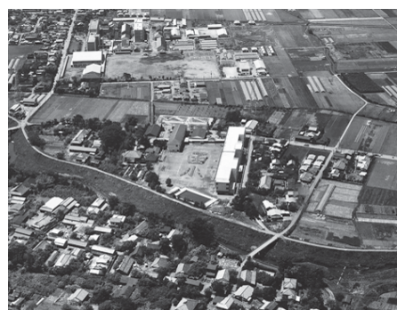
航空写真からの函南小学校（人文字）