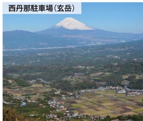
西丹那駐車場(玄岳)