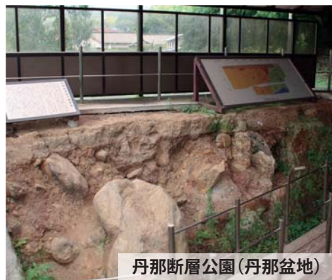
丹那断層公園(丹那盆地)