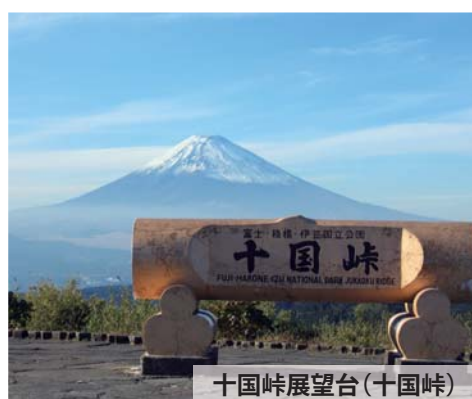
十国峠展望台(十国峠)