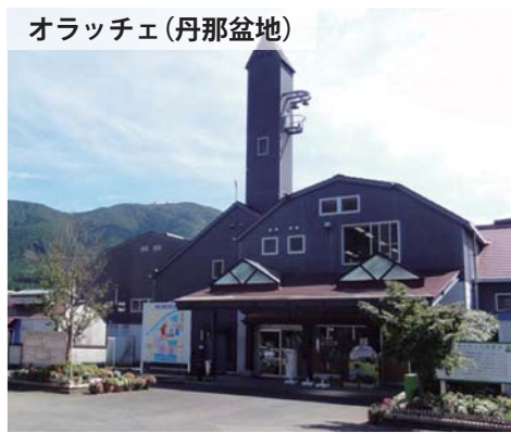
オラッチェ(丹那盆地)