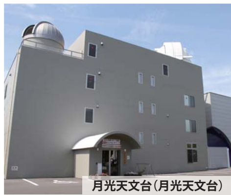
月光天文台(月光天文台)