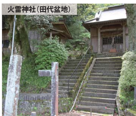
火雷神社(田代盆地)

伊豆半島ジオパークには15市町のエリア全てと海岸から3kmの範囲の海域が含まれています。このエリアの中で、地質的に貴重な場所など114箇所をジオサイトと呼び主な見どころとしています。またその中で、地質・地形・歴史などそのジオパークを特色付ける見学場所や拠点となる施設のことをジオポイントと呼びます。函南町内のジオサイト、ジオポイントの一部をご紹介します。