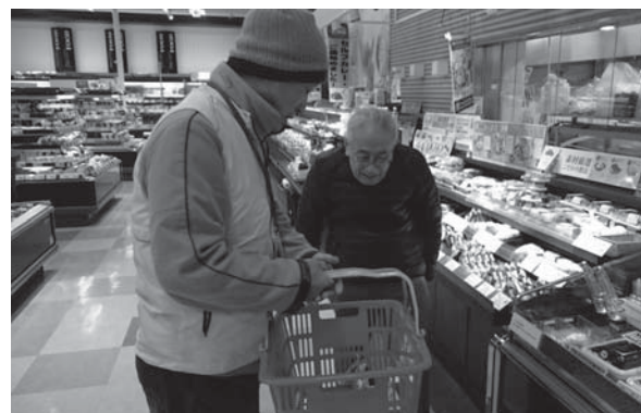
▲買い物を手伝う生活支援ボランティア

地域の支えあい協議会を開催し、買い物やゴミだし、食べること、認知症、一人暮らしの不安などの暮らしの困りごとについて住民の皆さんや民生委員や社会福祉法人、企業など地域の皆さんと話し合ってきました。