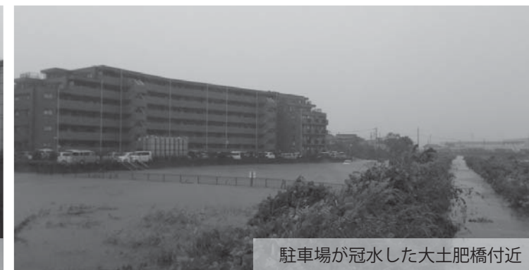
駐車場が冠水した大土肥橋付近