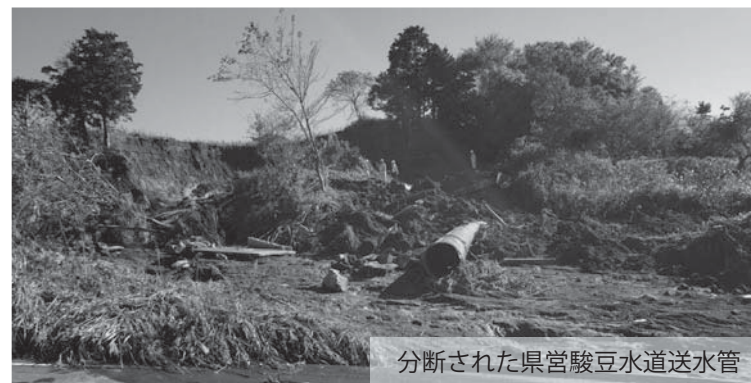
分断された県営駿豆水道送水管

令和2年1月8日(水)～令和2年1月31日(金) ※対象予定者には12月下旬に通知します。