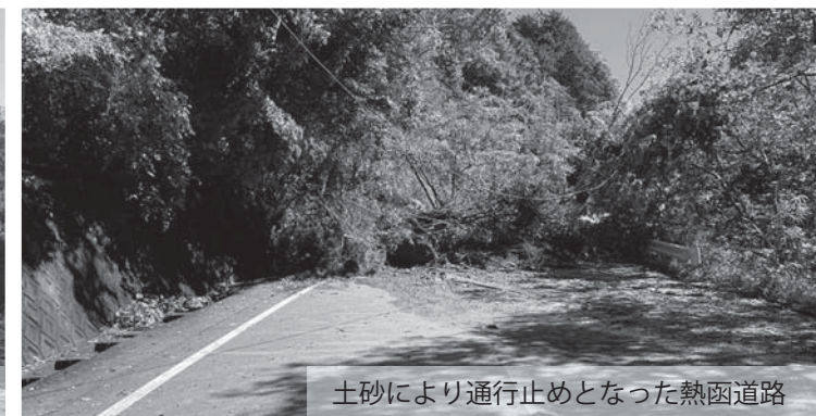
土砂により通行止めとなった熱函道路