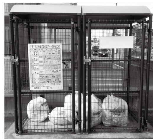
▲町内のごみステーション

町内が皆さんの協力により美観が保たれてきました。ごみ置場の利用者のモラルが大事だと感じています。今後も町と回収業者と委員との協力体制を築いていきたいと思っています。