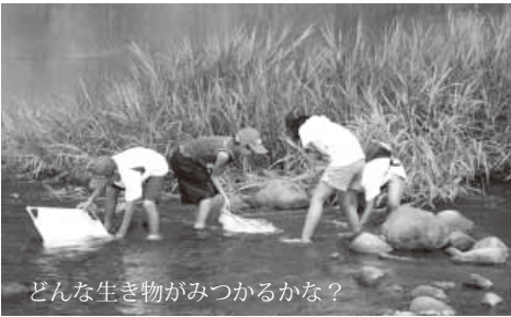
どんな生き物がみつかるかな？