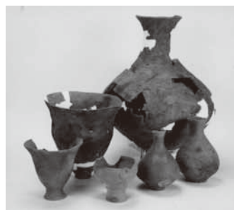
▲函南町から出土した弥生時代の土器

町内の遺跡発掘調査で見された出土品と、調査の様子を撮影した写真パネルなどを展示します。 夏休み、函南町に実在した太古のロマンに思いを馳せてみませんか。 小学生の皆さんは、函南町の遺跡について夏休みの自由研究を行うのも楽しいかもしれません。お気軽にお越しください。 日時／7月31日(土) 8時30分～21時 場所／函南町中央公民館 館玄関ホール 内容／町内の遺跡発掘調査で出土した土器など 対象／どなたでも 入場料／無料