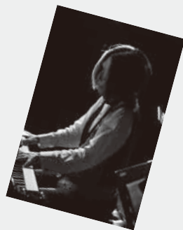
ピアノ奏者 宮川彬良 AKIRA MIYAGAWA