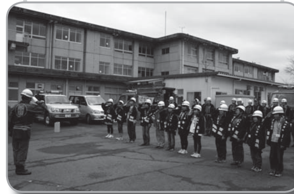
▲団長に敬礼をする桑村小学校の5年生・6年生

2月26日、春季火災予防週間の一環として、町内各所で春季火災予防運動が行われました。パレードには、桑村小学校5年生・6年生の合計12人、函南町消防団、田方北消防署が参加しました。 参加した小学生は、消防車に分乗し、備え付けのマイクを使って元気に「消したはず 決めつけないで もう一度」などの統一標語で火災予防を呼びかけました。 また、町内大型店舗で女性消防団員が住宅用火災警報器の設置を呼びかけるチラシ配布など街頭啓発活動も行われました。