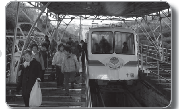
▲富士山の日イベントにたくさんの人が参加しました。

2月23日は「富士山の日」です。来年の世界文化遺産登録を目指し、この日を中心に県内のさまざまな地域で富士山に親しむイベントが行われました。 町でも、富士山の日をPRするためのイベントとして「富士山を再発見するツアー」を開催しました。 町内外から22人が参加して、十国峠、丹那断層、湯くトピアかんなみを訪れました。 当日はあいにくの天候で富士山を眺めることはできませんでしたが、町の地域資源を体験するいい機会になったと参加者は話しました。