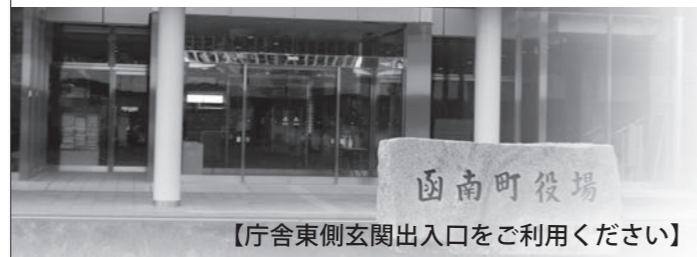
【庁舎東側玄関出入口をご利用ください】

※他の官公署へ照会が必要なものは受け付けできない場合があります。不明な点などは事前にお問い合わせください。