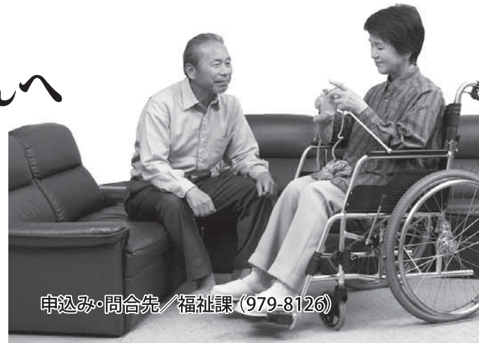
申込み・問合せ先/福祉課(979-8126)

介護保険の要介護認定による要介護4または5の人を在宅で介護している世帯で対象と思われる人(介護者)には、9月上旬に申請書を送付します。新規申請をする人は福祉課へお申し込みください。