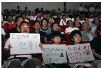
▲残念そうな表情を浮かべる関係者ら

同日、大仁市民会館(伊豆の国市)でパブリックビューイングが開催されました。会場に訪れた関係者らは、残念そうな表情を浮かべましたが、指摘事項を改善し、加盟に向けて頑張ろうと気合を入れ直しました。