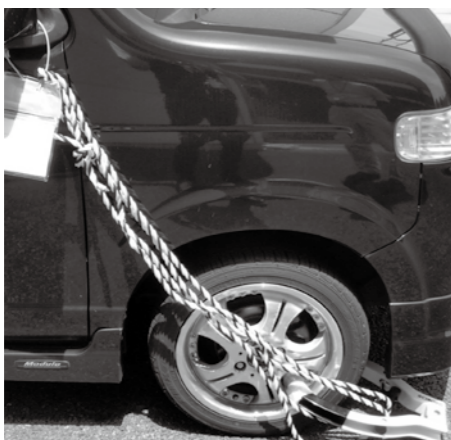
▲タイヤロックによる差し押さえ

忙しくて納付に行く時間のない人には、便利な口座振替をお勧めしています。口座をお持ちの指定金融機関（納付書などの裏面に記載されている金融機関）に預金通帳と届け出印を持参のうえ、お申し込みください。また、町外の金融機関には振替依頼書（申込用紙）を用意していない場合がありますので、あらかじめ税務課へ振替依頼書をご請求ください。