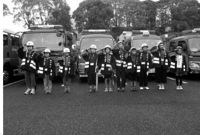
▲消防車の前で敬礼する函南小学校の6年生10人

また、函南町女性消防団員により、町内のスーパーなどで火災予防の啓発を行いました。