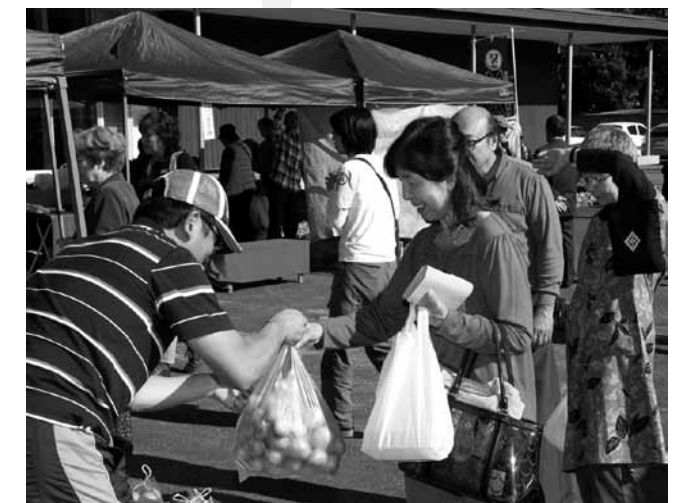
▲新鮮な野菜などを購入する来場者

朝市では、ニンジン、キャベツ、カブなどの新鮮野菜やサバ、アジ、イカなどの海産物、みかん、カーネーションなど12店舗が出店し、買い物を楽しむ来場者などでにぎわいました。