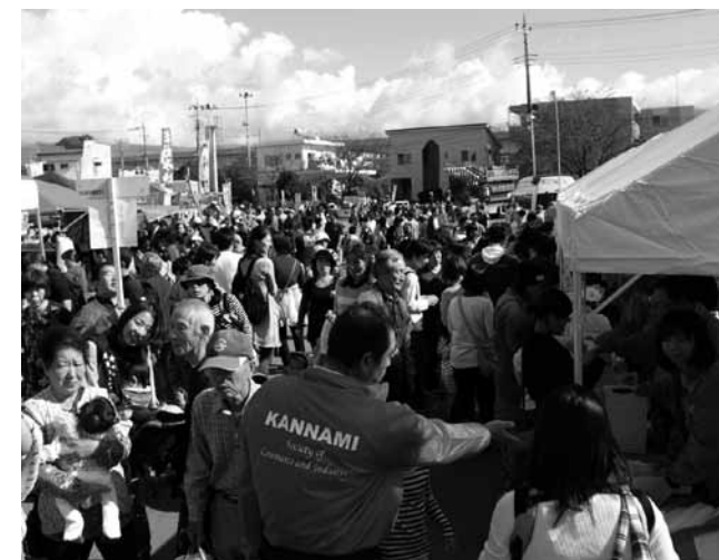
▲さまざまなイベントを楽しむ来場者でにぎわいました

11月3日、函南町商工会館前広場、函南中学校駐車場で第39回かなみ商工まつりが開催されました。