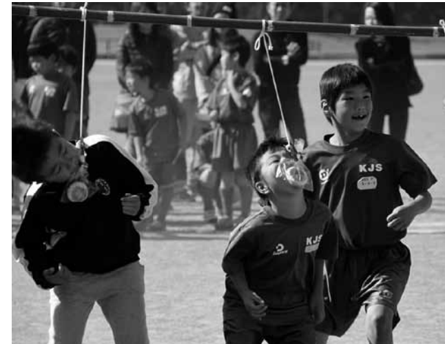
▲争奪パン食い競走で一生懸命パンにかぶりつく参加者

11月1日、かなみスポーツ公園でかなみスポーツ健康フェスタ2015が行われました。