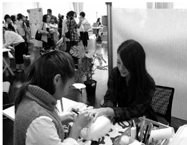
▲ネイルアートを施してもらい息抜きする子育てママ

11月12日、子育て交流センターで子育てセミナー「素敵な時間のプレゼント」が行われました。