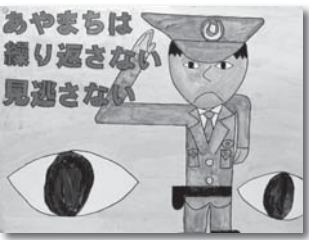
更生保護女性会長賞