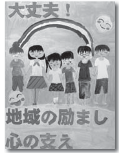
社会福祉協議会長賞