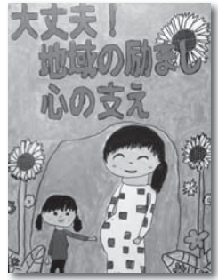
三島地区保護司会長賞