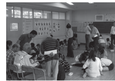
▲桑村小での話し合いの様子

6月に町内の小学校で交通安全リーダーと語る会が開催され、交通指導員が出席しました。各小学校の6年生たちが交通安全リーダーとして、通学路の危険な箇所をよく理解し、下級生の指導をしていることがわかりました。