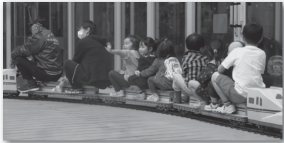
▲前回開催時の様子