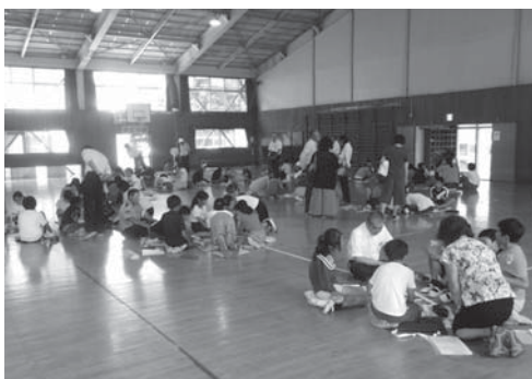
▲西小学校での話し合いの様子

6月から7月にかけて町内の小学校で交通安全リーダーと語る会が開催され、交通指導員が出席しました。各小学校の6年生たちが交通安全リーダーとして、通学路の危険な箇所をよく理解し、下級生の指導をしていることがわかりました。交通安全リーダーが気づいたことについての意見交換や交通指導員が日頃の通学指導を通じて感じていることを交通安全リーダーたちに伝え、事故に遭わないためにどうすればよいか、有意義な話し合いができました。