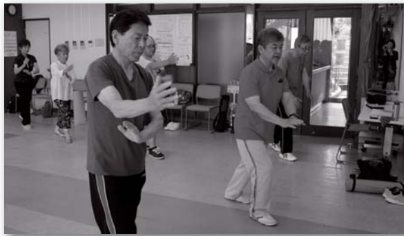
▲太極拳レッスンの様子