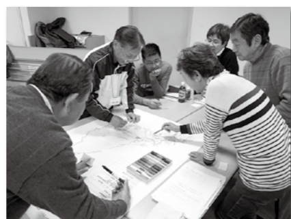
▲地域づくりにおけるワークショップの様子