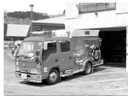
▲老朽化したポンプ車の更新