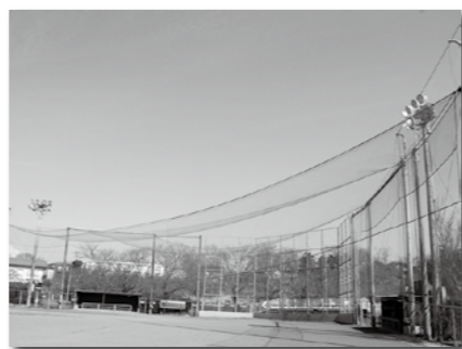
▲柏谷公園野球場の照明のLED化