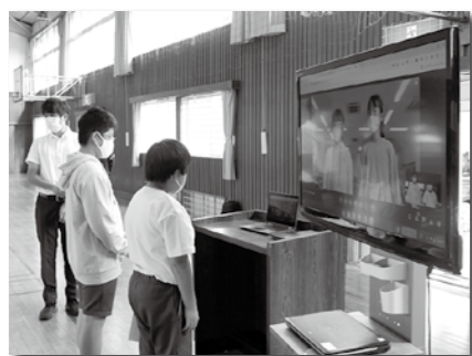
▲ICTを利用した遠隔授業の風景