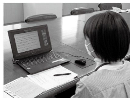
▲オンラインでの離乳食相談