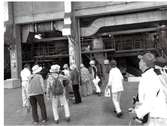
▲焼却場見学の様子

町のバスで町内を巡り、公共施設などを見学する「函南町タウンウォッチング」を実施します。町のことを知り、ふるさとの魅力を再発見してみませんか。お気軽にお問い合わせください。