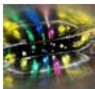
▲キラキラプラネタ リウムボックス作り